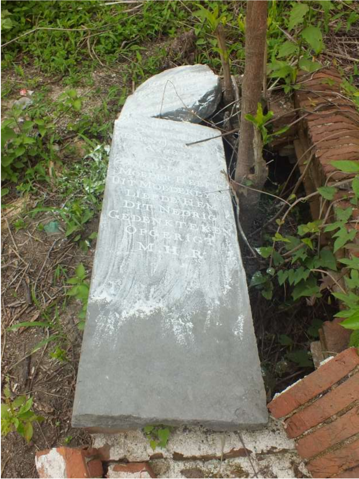
De grafsteen van Pieter Rompelman, foto Stichting Gebouwd Erfgoed Suriname (SGES), 19 mei 2022