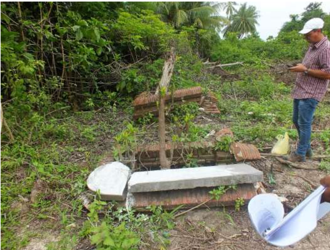
Het survey-team van Stichting Gebouwd Erfgoed Suriname (SGES) bezig met documenteren 19 mei 2022