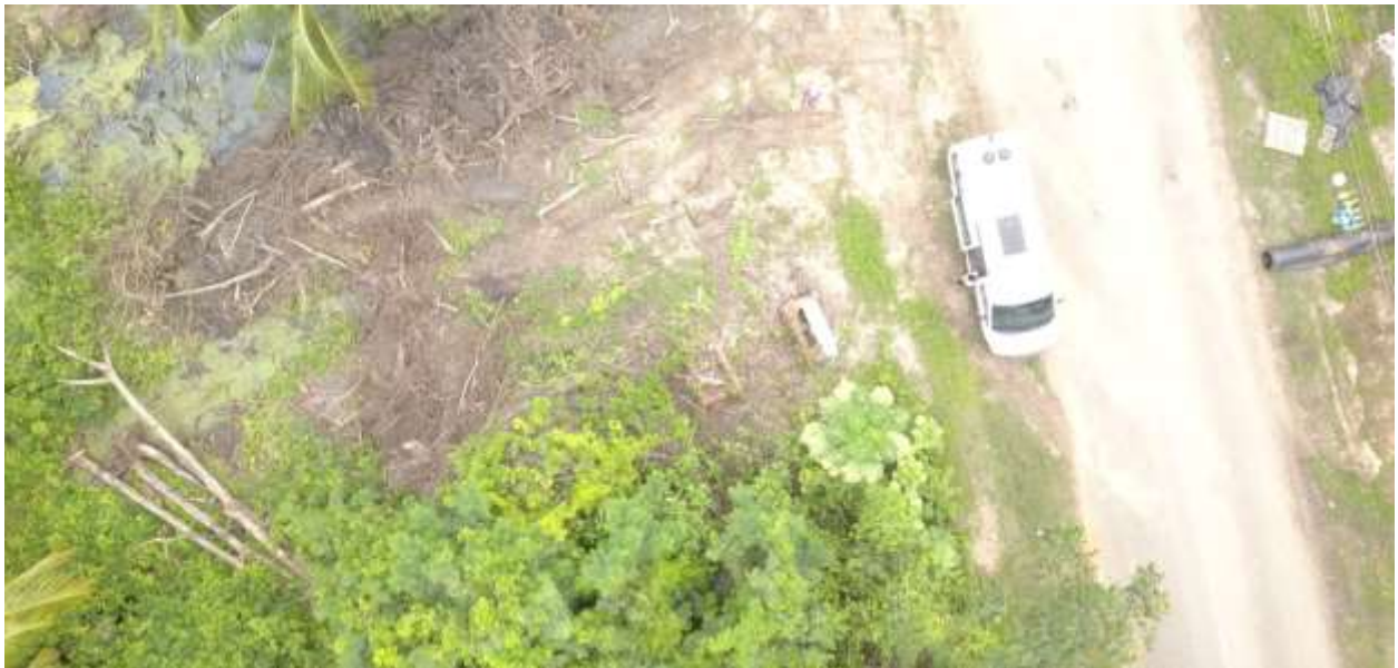
Luchtfoto's historische graven van de MacDonalds, drone image Stephen A. Fokké/SGES, coll. SGES 19 mei 2022

Op 19 mei 2022 verscheen een publicatie over de herkomst van de Surinaamse MacDonald familie getiteld The MacDonalds of Suriname-The Ancestors (De MacDonalds van Suriname-De