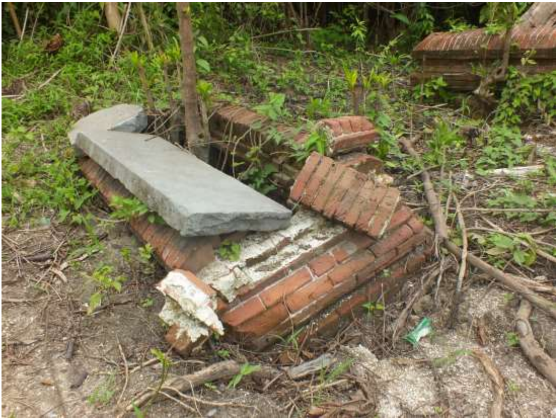
Impressie van de toestand van de bakstenen graven, coll. SGEs 19 mei 2022