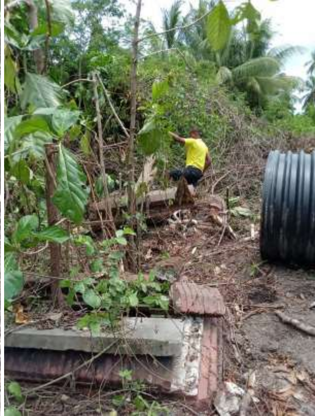
Situatie van de graven anno 2 mei 2022. Verse sporen van beschadiging