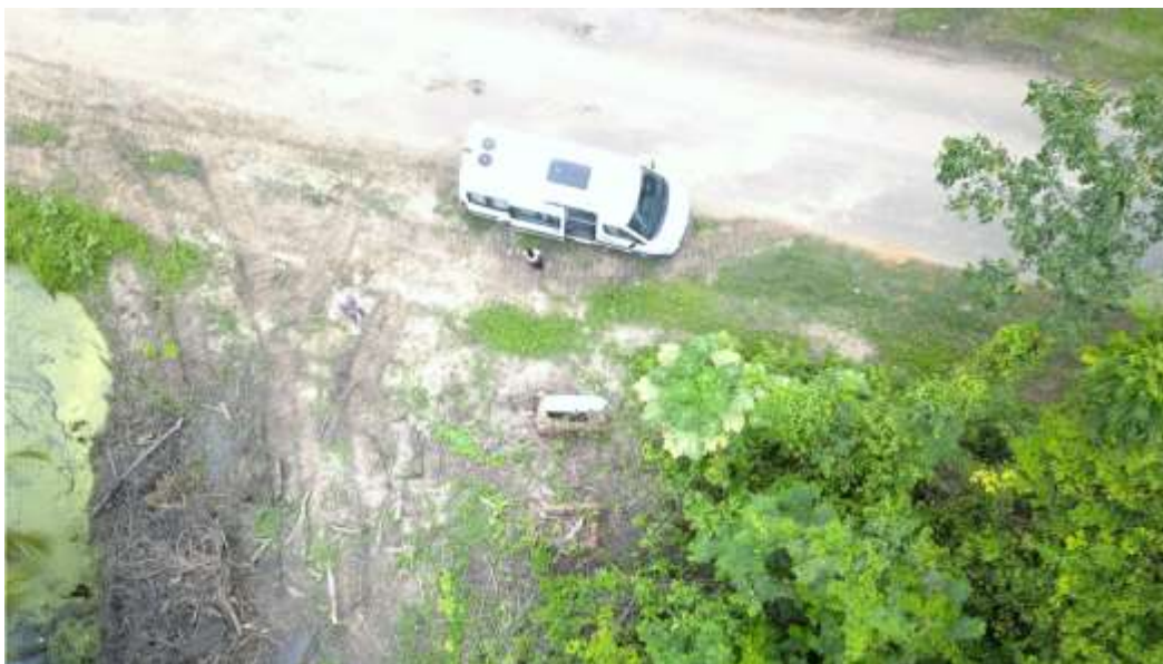
Ligging van de graven langs de Oost-West verbinding

Aantal graven: twee bakstenen graven daterend uit de 19e eeuw (zonder grafsteen) en één losse natuurstenen grafsteen uit 1823.