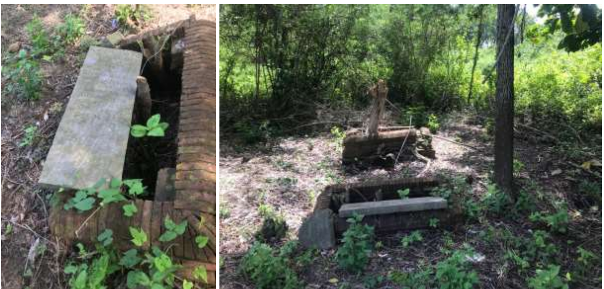
Situatie van de graven in 2012. De bakstenen structuur van het eerste graf is nog redelijk in takt