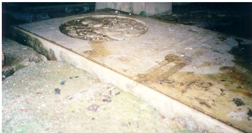
Katwijk. Het graf van Alydus Swaen onder 1 der arbeiderswoningen. Foto KDV architects, 2000.

locatie: plantage Katwijk, Commewijnerivier. details: Familiebegraafplaats, 2 graven. Dit graf ligt thans (2000) onder een der arbeiderswoningen. bijz.heden: opname Philip Dikland, 2000