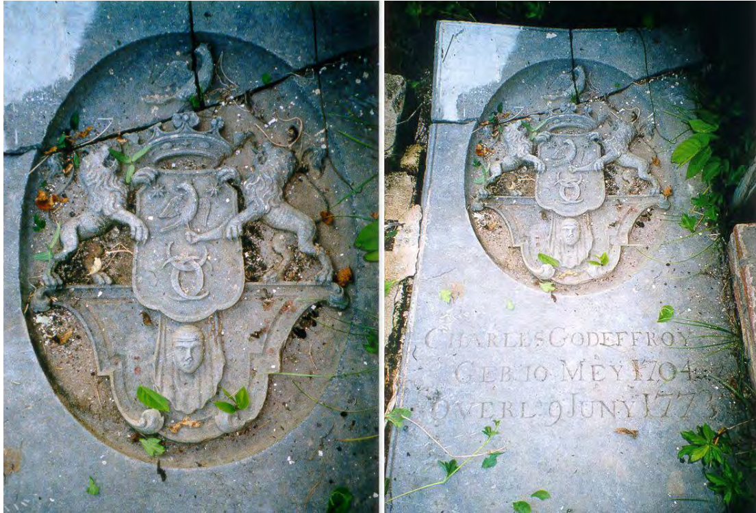
Alkmaar, het graf van Charles Godeffroy.