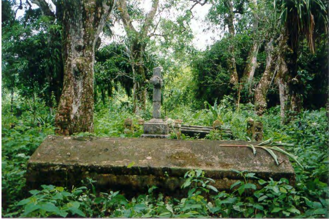
De directeurenbegraafplaats te Marienburg. Foto Philip Dikland, 2001.

Op de nog in gebruik zijnde plantages worden de oude grafplaatsen redelijk bijgehouden. Op Marienburg is er achter in de plantage de directeurenbegraafplaats, met dertien grafmonumenten overschaduwd door fraaie oude bomen. Op Rust-en-Werk ligt de oude grafplaats van de familie Crommelin nu in een weiland, maar eens was daar de achtertuin van het grote huis. De grafplaats is afgezet zodat de koeien buiten blijven, en wordt onderhouden. De plantage telt nog een tweede grafplaats uit de 19e eeuw.