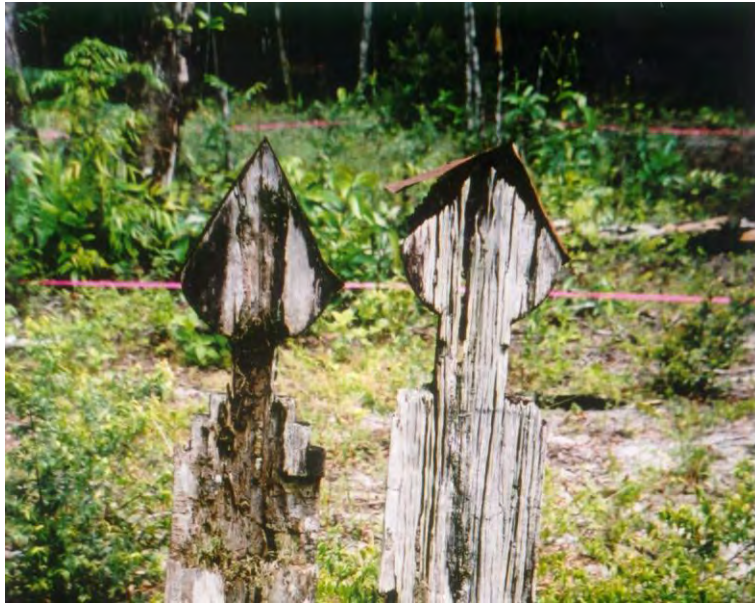
Grafpaaltjes met hartvormig en rond bovineinde op de creoolse begraafplaats te Jodensavanne. Ook bij andere creoolse grafplaatsen treft men deze symboliek aan. Foto Marianne Hiralal, 2002.

In Para is er dus sprake van continue bewoning vanaf de slaventijd tot heden. Men mag aannemen dat er ook continuïteit is in de begrafenisgebruiken. We zien er begraafplaatsen niet ver van de woonkern, met houten graftekens met rond of hartvormig bovineinde. Waarschijnlijk was het in de slaventijd ook al zo.