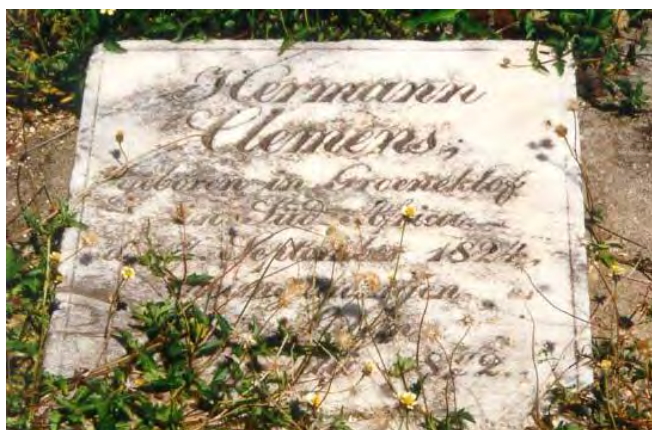
Salem. Het graf van Hermann Clemens. Foto KDV architects, 2003.