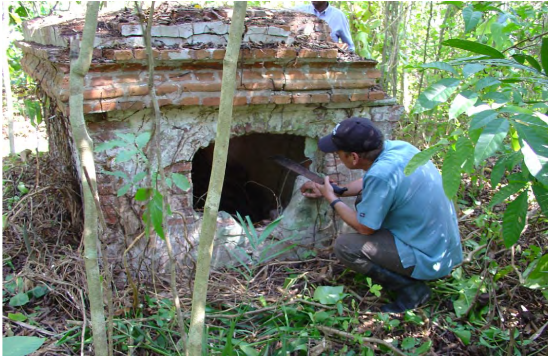
Grafonderzoek op plantage Waterloo. Er is ooit in het graf ingebroken en de naamplaat verwijderd.