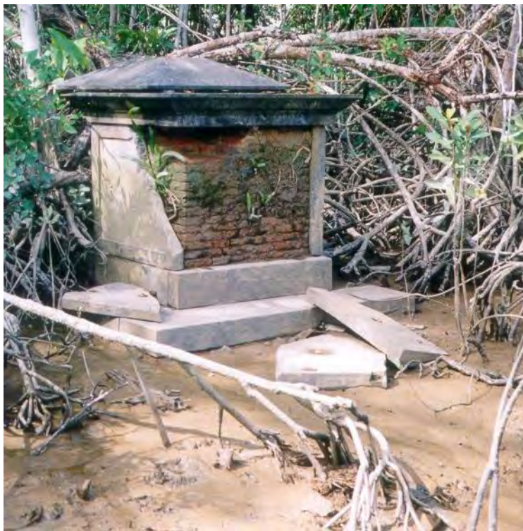
geschonden graf op plantage Vertrouwen. Foto Dikland, 2002

Vandalisme komt af en toe voor, zoals bij het grafmonument van Anna Maria Taunay op plantage “het Vertrouwen”. Dit ligt door landerosie vlak bij de rivier, en werd door vissers bewerkt om een vermeende schat binnenin te ontdekken.