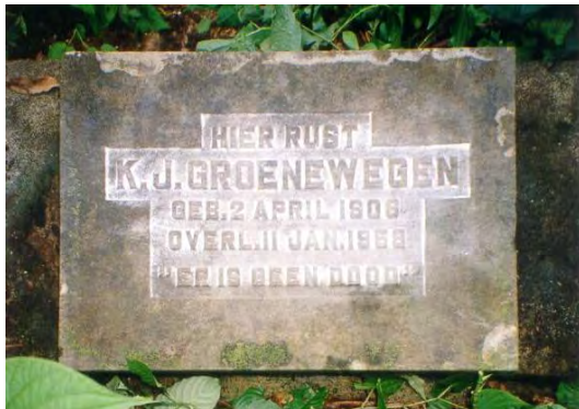
het Graf van Groenewegen. Foto KDV architects, 2001

naam: Groenewegen, K: J: grafschrift: Hier rust / K: J: Groenewegen / geb: 2 april 1906 / overl: 11 jan: 1959 / "er is geen dood" leeftijd: 52 jaar (1906-04-02 - 1959-01-11) locatie: plantage Marienburg, Commewijnerivier. "nederlandse" begraafplaats, achter in de plantage ter plaatse van de treinbaan. 12 graven bijz.heden: opname Philip Dikland, 2001