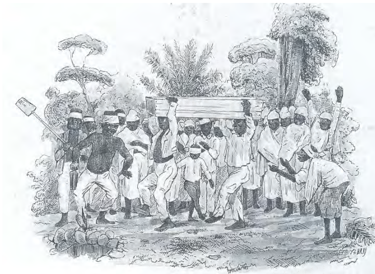
“Heiden begrafenis op een plantage” – Theodore Bray, 1850.

De wijze van begraven staat afgebeeld op een prent van Bray uit 1850. We zien de kist met de dragers die lopen in dezelfde onvoorspelbare pas als thans nog wordt gebruikt bij creoolse begrafenis. De pas was met opzet onvoorspelbaar om de geesten achter de kist het spoor bijster te doen raken, zodat de dode in vrede zou rusten.