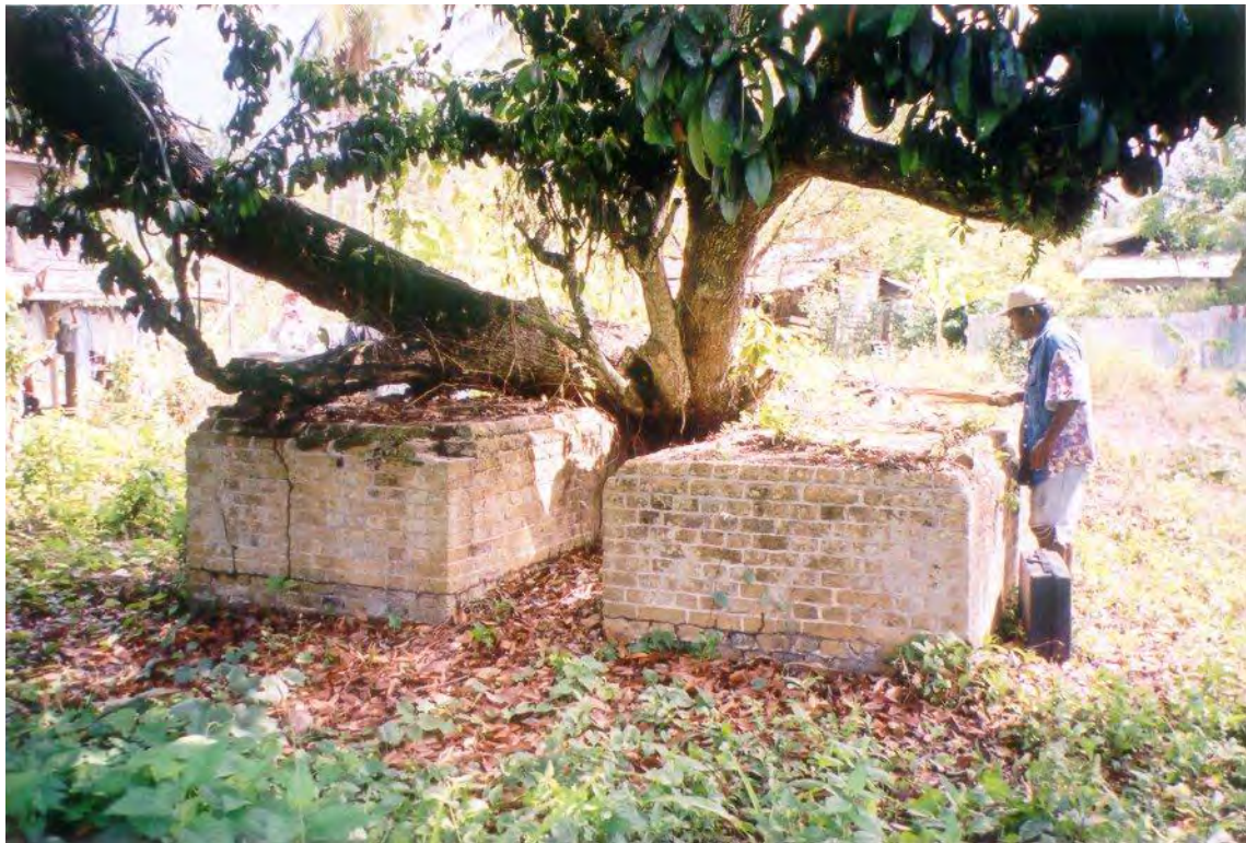
dubbele graftombe te Paradise. De naamplaten zijn verwijderd. Foto KDV architects, 2003.

naam: onbekend grafschrift: onbekend (grafplaten weggebeiteld) leeftijd: onbekend locatie: plantage Paradise, Nickerie details: Dubbele graftombe (man + vrouw ?) op het perceel van Samuel Chester ; vermoedelijk de locatie van het vroegere plantagehuis. 2 bakstenen tombes van grote gele steen, vroeger afgedekt met grijze plavuizen en een grafplaat. Deze grafplaten zijn thans verdwenen, volgens de daar woonachtige Samuel Chester " weggehaald door familieleden van de overledenen uit Europa ". bijz.heden: opname Philip Dikland, 16 nov. 2003.