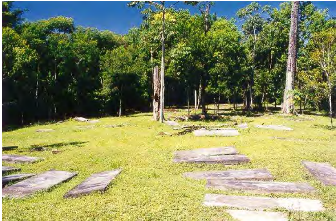
het Beth Haim te Jodensavanne. Foto Marieke Visser, 1999

De joodse planters vochten een medogenloze oorlog met de marrons uit. Aan beide zijden dappere en onverzettelijke mensen, overtuigd van hun eigen gelijk. De grafsteen van David Monsanto herinnert daaraan. Hij werd in 1739 op het Beth Haim van Jodensavanne begraven :