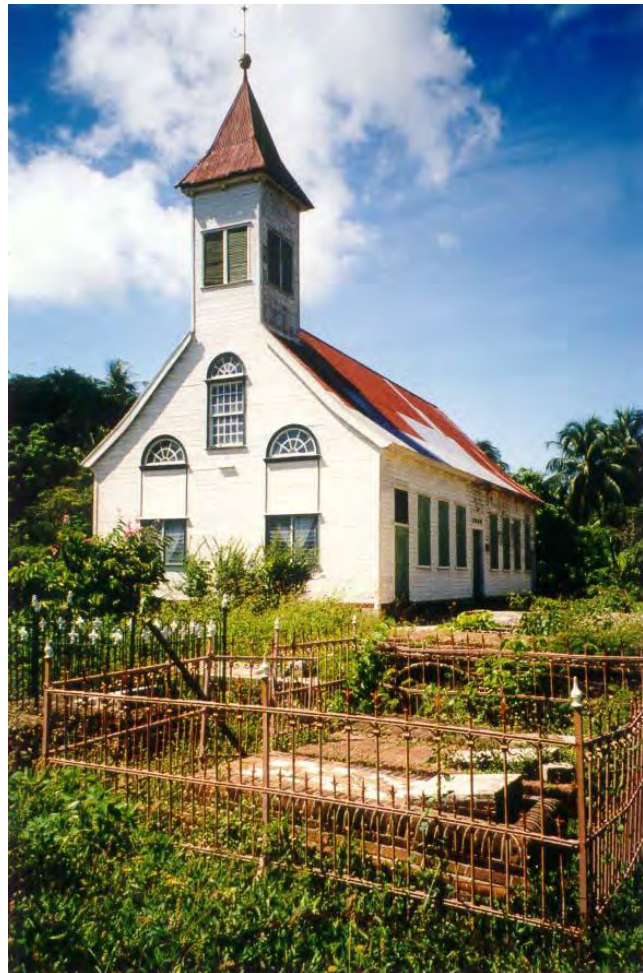
EBG-grafplaats op de plantage Clyde in Coronie.

De vrije gekleurde bevolking werd mogelijk deels op de plantages begraven, maar werden ook begraven op de kleine dodenakkers naast de districtkerkjes. Bij wet was iedere vrijgemaakte verplicht een godsdienst te kiezen, en zij hadden dus ook het recht om begraven te worden bij de kerk van hun keuze. Zo treffen wij te Coronie bij alle kerkjes kleine intieme grafplaatsen met 19e en 20ste eeuwse graven. Alleen te Totness en Friendship, de kern van het district, zijn de grafplaatsen groter.